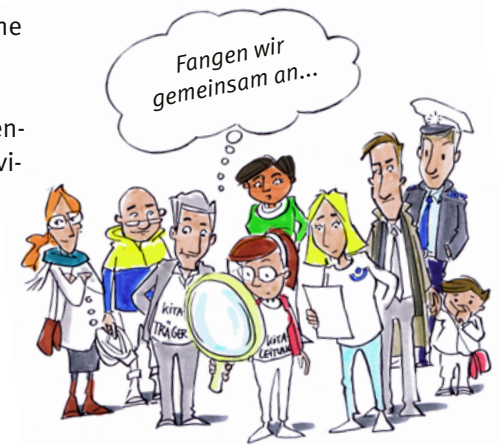
Abbildung: zentrale Schritte einer Organisationsentwicklung

Die Entwicklung der Kultur der Prävention ist ein andauernder Prozess, da sich die spezifischen Gegebenheiten einer Einrichtung und die individuellen Verhaltensweisen ihrer Mitglieder permanent ändern. Demzufolge sollte eine Kita oder Schule nach dem Erreichen eines Ziels bzw. dem Abschluss einer Maßnahme die Entwicklung der Präventionskultur mit neuen Zielen und Aktivitäten fortsetzen.